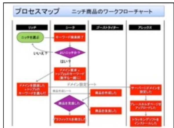
プロセスマップの例